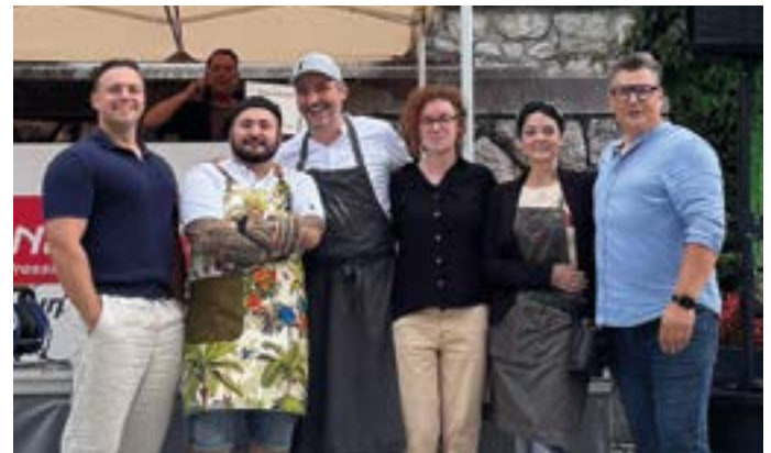
Das Organisationsteam der Altstadtparty.

Gemeinsam laue Sommerabende erleben, Menschen treffen und die besondere At-