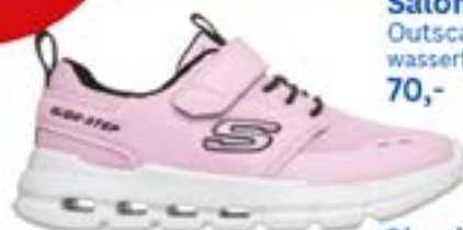
Skechers Kids Glide 39,-