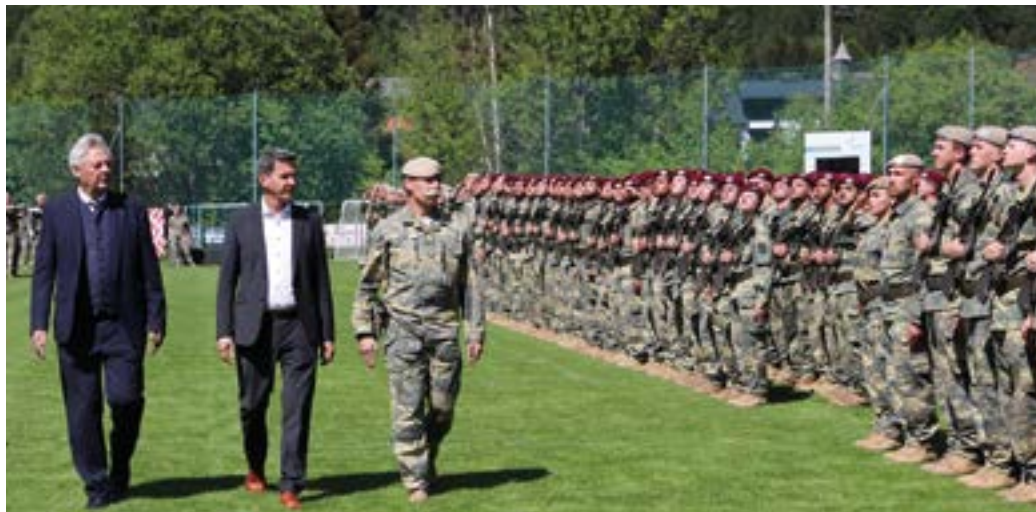
Abschreiten der anzugelobenden Heeresformationen gemeinsam mit Landeshauptmann und Brigadefamandant.