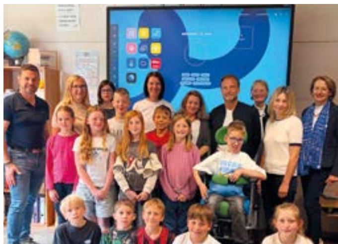
Neue Digitale Schultafel der VS Hermagor.