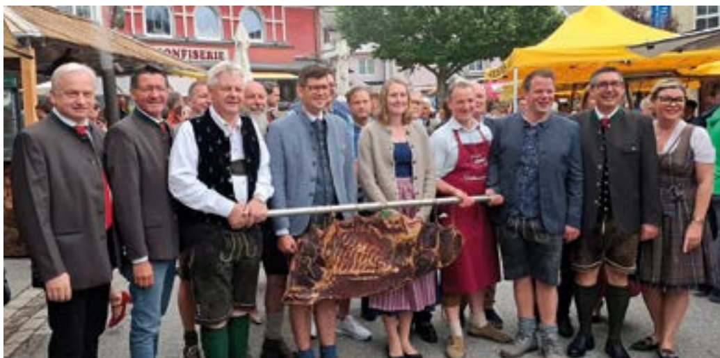
Das Speckfest beginnt mit dem Einmarsch zum Speckanschnitt auf dem Hauptplatz.