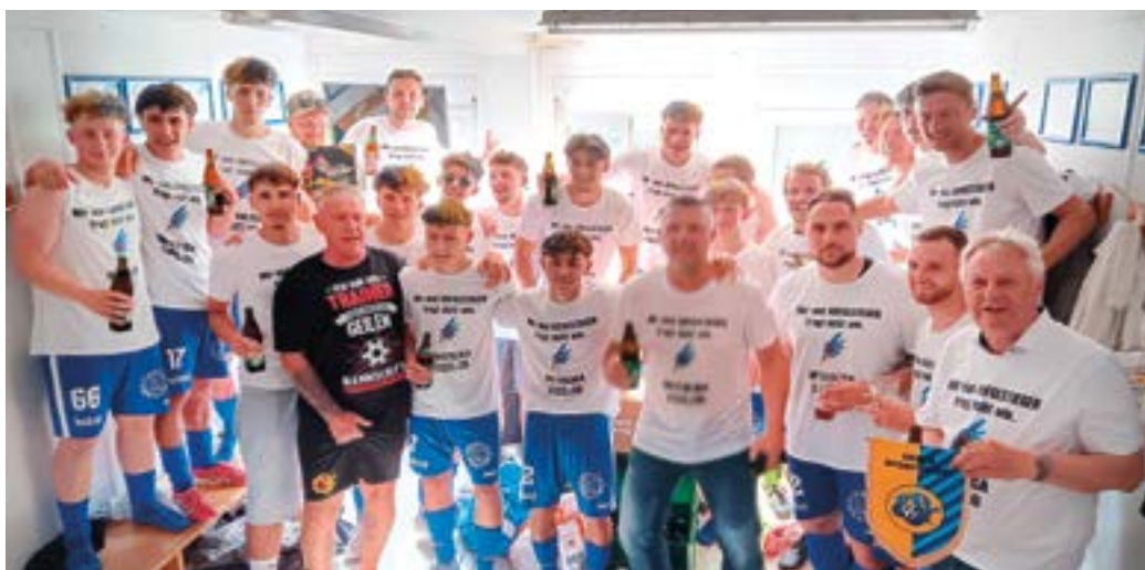
Große Feier der Spieler nach dem letzten Match.

Erstmals in der Vereinsgeschichte schafften die Fußballer des SV Egg den Aufstieg in die Unterliga. Die Freude bei Spielern wie auch bei den Fans war riesig. Der Verein setzt großteils auf Eigenbauspieler. Ich wünsche dem SV Egg alles Gute für die nächste Spielsaison in der Unterliga West.