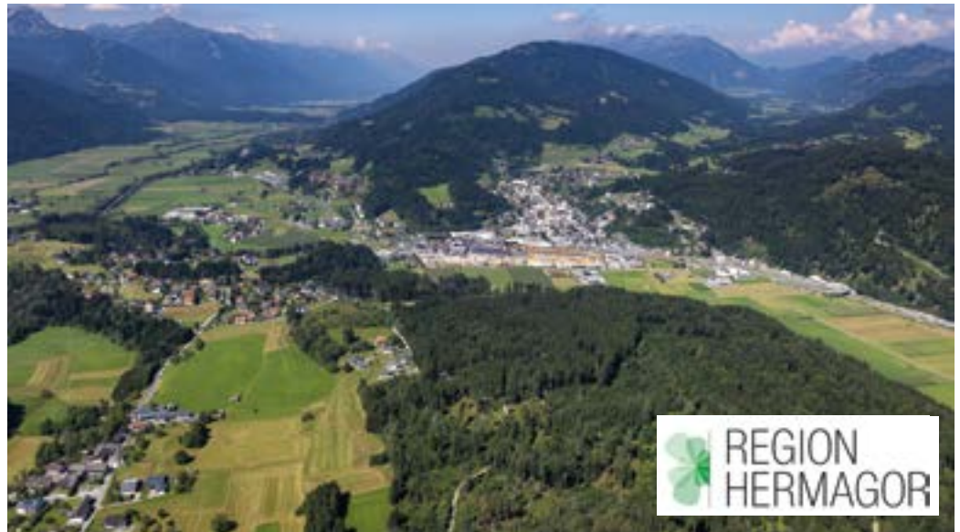
Blick auf Hermagor und Guggenberg.