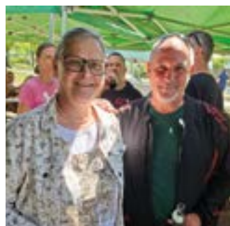
Race Cup Kärnten 2026