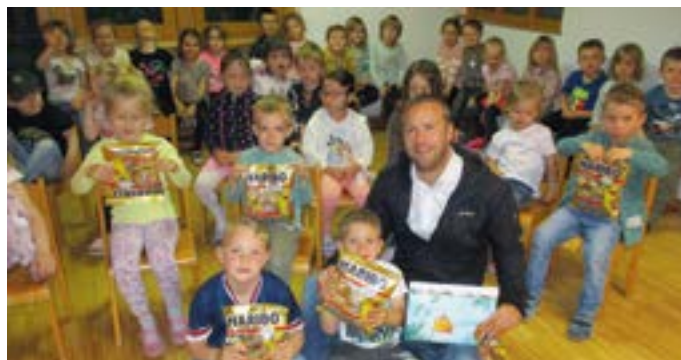
Auch die Kinder des KG Pressegger See halfen fleißig beim Müllsammeln mit.