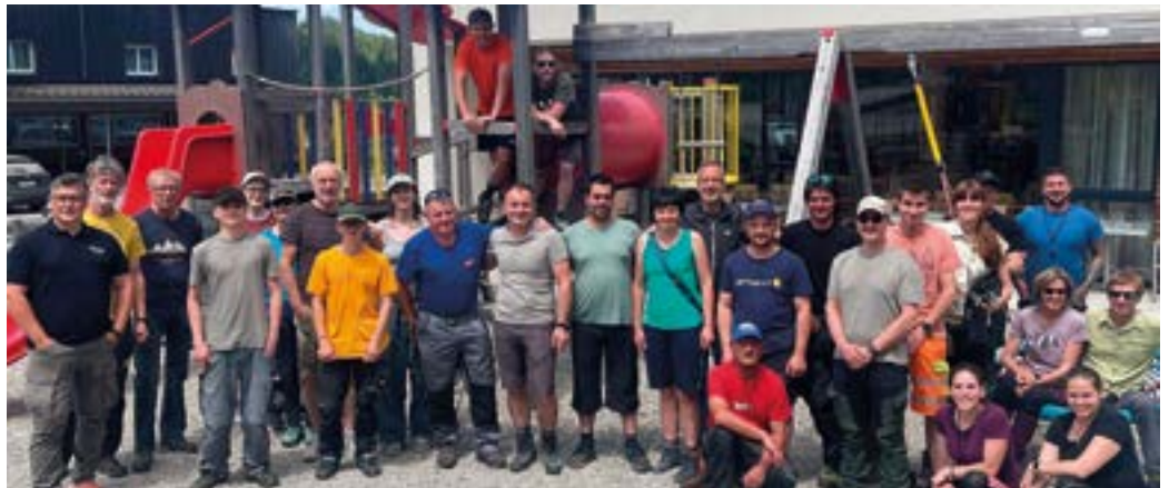
Erfolgreiche Müllsammelaktion am Nassfeld.

Mit dabei waren Mitarbeiter:innen der Stadtgemeinde Hermagor-Pressegger See, der Bergbahnen Nassfeld Pramollo AG, der Nassfeld Lift GmbH & Co KG, der Madritschen Seilbahn und Tourismus GmbH, der Nachbarschaften der Treßdorfer Alm und Watschiger Alm, von Sport Sölle, dem Gasthaus Treßdorfer Alm, dem