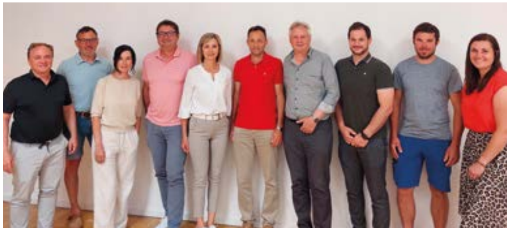
Mitglieder des Ausschusses und Bürgermeister.

Eine sehr erfreuliche Nachricht gibt es dieses Jahr vom Sport zu berichten. Der SV Egg steigt nach einer überaus erfolgreichen Fußballsaison erstmals seit seinem Bestehen in die Unterliga auf. Hervorzuheben ist, dass neben der Kampfmannschaft von den Funktionären und freiwilligen Helfern auch eine Challenge- und mehrere Nachwuchsmannschaften ehrenamtlich betreut werden. Ein aufrichtiges Dankeschön und eine herzliche Gratulation ergeht an die Repräsentanten des SV Egg für ihre wertvolle Arbeit. Im Mai wurden im Stadtbereich von Hermagor zwei wichtige Baulose fortgesetzt bzw. wurde mit folgenden Bautätigkeiten begonnen: