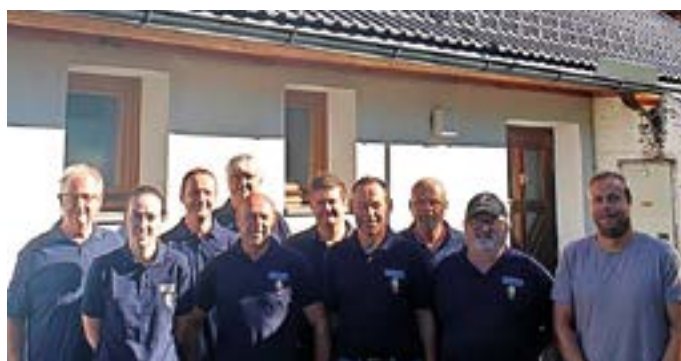
Dachsanierung FF Görtschach.