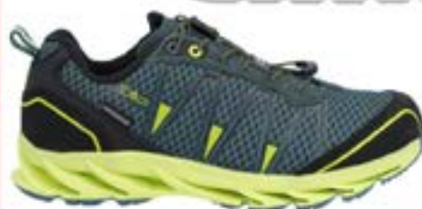
CMP Kids Altak wasserfest! 59,-

FOX Fahrwerk mit 160mm, Sram 12 Gang, Teleskob- Sattelstütze