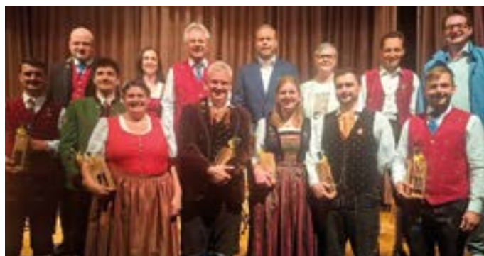
Obleute, Kapellmeister und Gemeindevertretung.

Ein herzliches Dankeschön an alle beteiligten Firmen für die professionelle und termingerechte Ausführung. Den Kameradinnen und Kameraden der Freiwilligen Feuerwehr Görtschach wünsche ich für ihre ehrenamtliche und engagierte Tätigkeit weiterhin alles Gute sowie stets sichere und unfallfreie Einsätze.