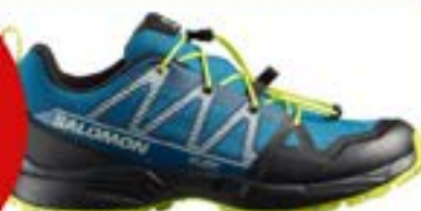
Salomon Outscape J. wasserfest! 70,-