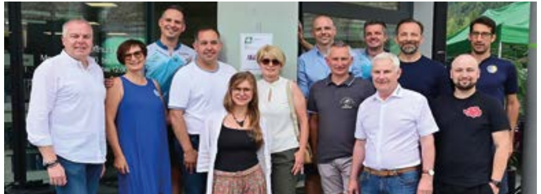
Die Mitwirkenden des Eggerstraßenfestes.

Für unsere Stadtgemeinde Hermagor-Pressegger See gratuliere ich als zuständige Wirtschaftsreferentin gemeinsam mit Bürgermeister DI Astner dazu und wünsche auch weiterhin alles Gute und viel Erfolg.