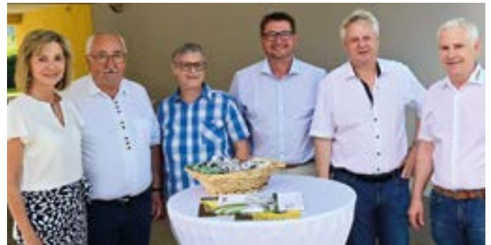
Auch seitens der Gemeinde stellten sich viele Gratulanten beim Eggerstraßenfest ein.

Die jährliche Großreinigung im Naturschwimmbad Radnig wurde heuer Mitte Mai vorgenommen. Die FF Radnig und der Badverein führten diese Wartungsarbeiten durch und