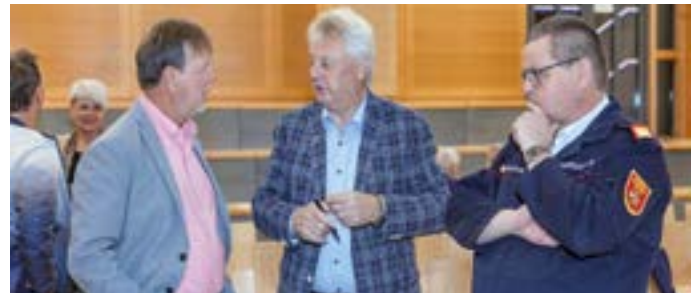
Auftaktveranstaltung der IREP (Klimawandelanpassungscheck)

Seit 2015 arbeitet die LEADER-Region Hermagor gemeinsam mit den italienischen Partnerregionen LAG Open Leader und LAG Euroleader im Rahmen der grenzüberschreitenden Kooperation HEurOpen zusammen. Die Zusammenarbeit erfolgt im Rahmen des europäischen Interreg-Programms und verfolgt das Ziel, den Grenzraum zwischen Kärnten und Friaul-Julisch Venetien gemeinsam weiterzuentwickeln. Gemeinsam mit Partnergemeinden aus Österreich und Italien werden Projekte umgesetzt, die den europäischen Gedanken mit Leben erfüllen und den Austausch über Grenzen hinweg fördern. Durch diese grenzüberschreitenden Projekte entstehen neue Kontakte, gemeinsame Veranstaltungen