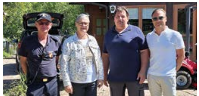
Großreinigung im Naturschwimmbad Radnig.

machten das „Radniger Bad“ für die heurige Badesaison startklar. Der Pächter, der Bädergeschäftsführer sowie zahlreiche politische Vertreter sorgten für die Verköstigung der freiwilligen Helferinnen und Helfer.