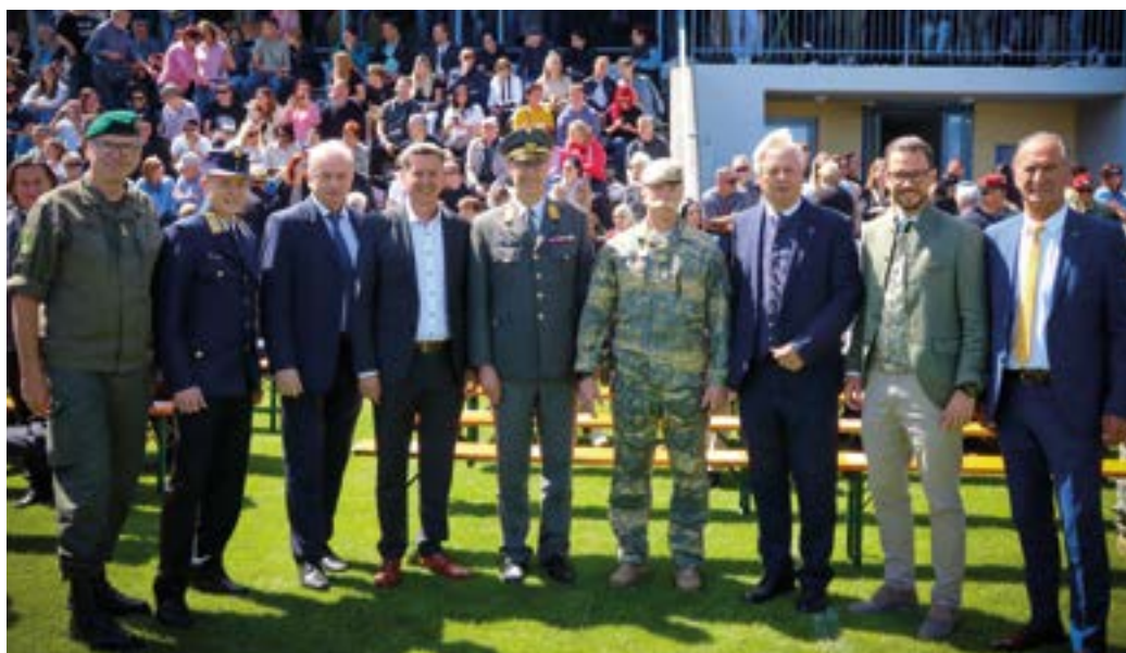
Viele Vertreter des öffentlichen Lebens waren bei der Angelobung anwesend.

Einsatzorganisationen, Verbände und Trachtenträger gekommen. Von Seiten der höchsten Bun-