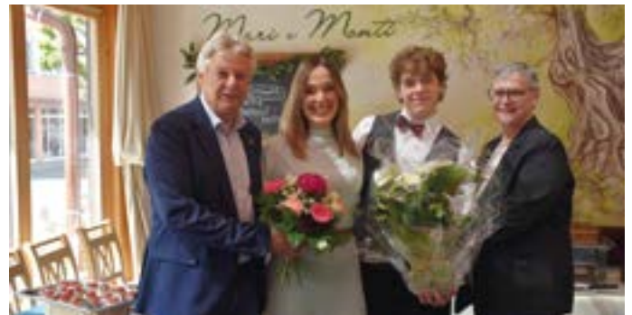
10 Jahre „Mari e Monti“