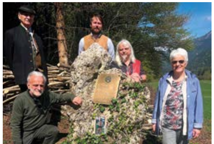
Jägerstein in Möschach