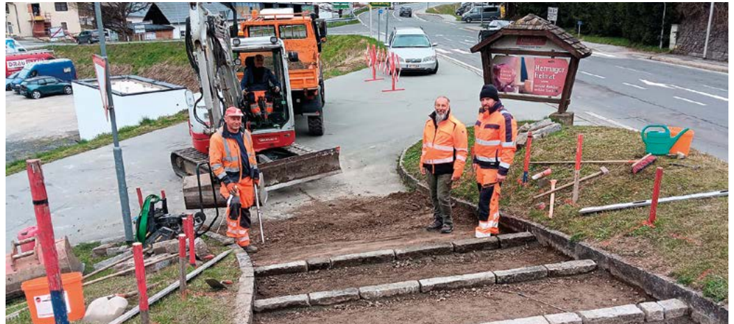
Sanierungsarbeiten beim Aufgang zum Kriegerdenkmal.

Gemeindestraßen bilden das feinmaschige Netz innerhalb von Ortschaften und stellen die Erreichbarkeit zwischen den einzelnen Gebäuden sicher. Wie schon in vorherigen Ausgaben des Mitteilungsblattes erwähnt, ist in unserem Gemeindegebiet ein Straßennetz von 184 Kilometern zu betreu-