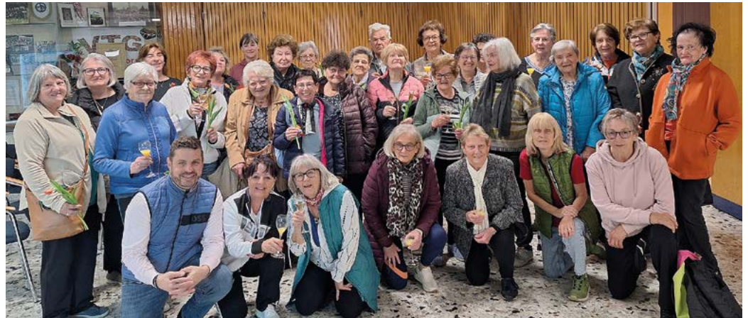
Seniorenturngruppe des SC Vellach.