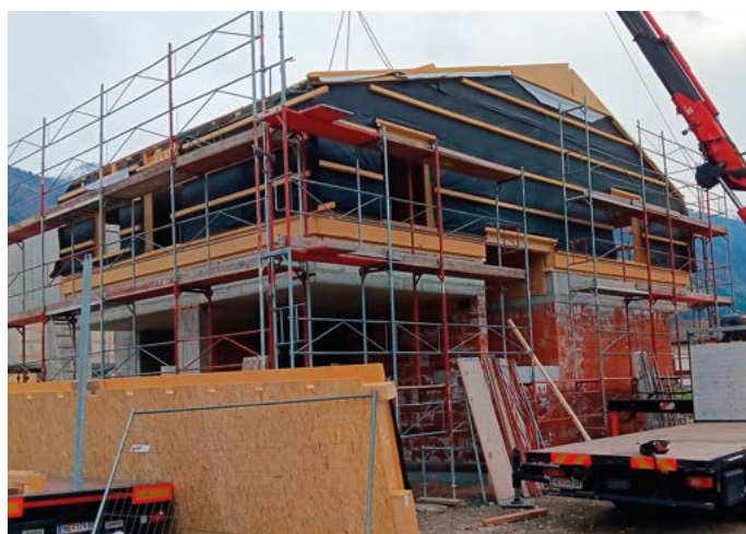
Der Neubau des Feuerwehrhauses Rattendorf schreitet voran.