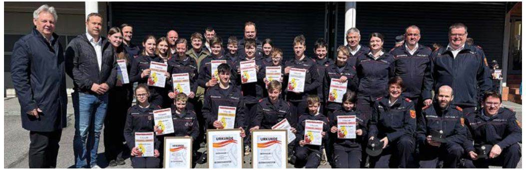
Erfolgreiche AbsolventInnen der Feuerwehrjugend.