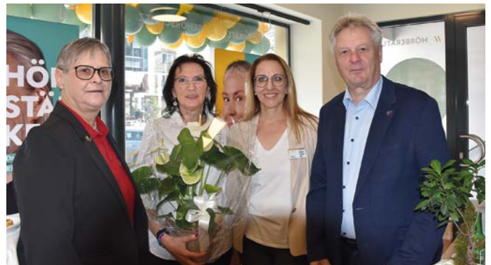
Neugestaltung des Hörfachgeschäfts Neuroth.