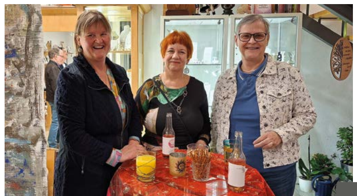
Vernissage im „Schmuckkastl“.