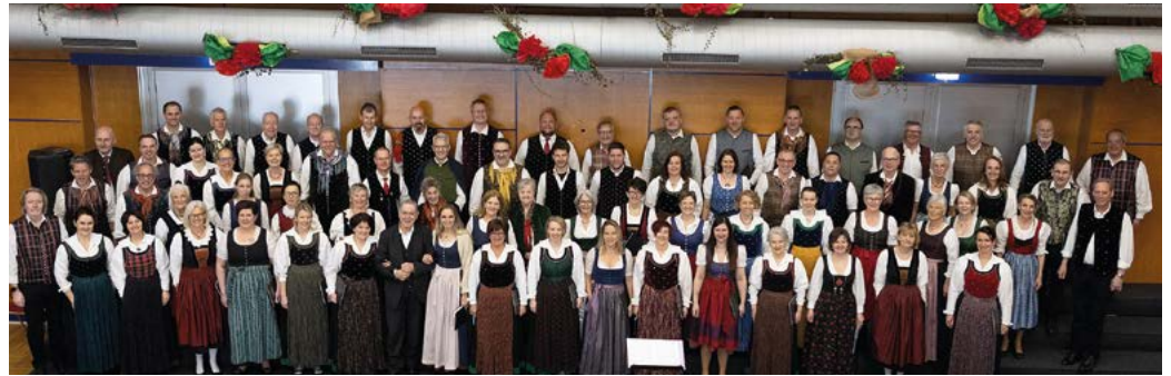
Der ProjEGGtchor begeisterte.