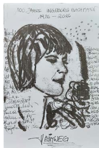
Bildgestaltung Inge Lasser