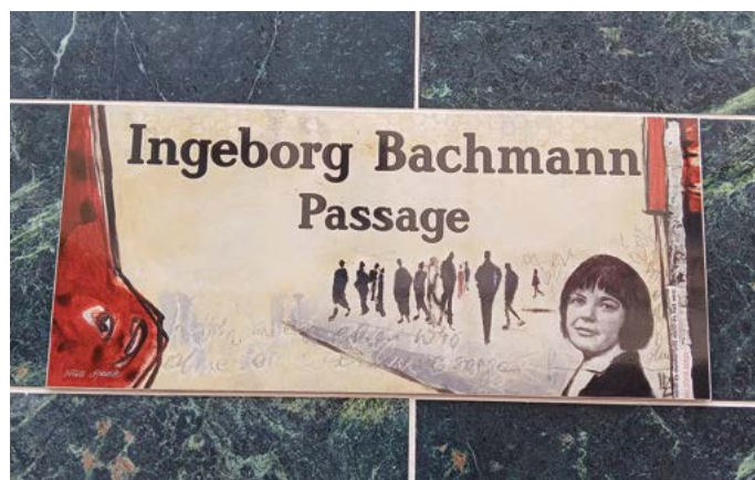
100. Geburtstag von Ingeborg Bachmann am 25. Juni 2026

Nach 16 Jahren findet am 13. Mai wieder eine Angelobung in Hermagor statt. Im Anschluss an eine Kranzniederlegung am Denkmal beim Friedhof wird um 15 Uhr die Angelobung von ca. 460 Rekruten auf der Gemeindegaststätte erfolgen. Die gesamte Bevölkerung ist herzlich dazu eingeladen.