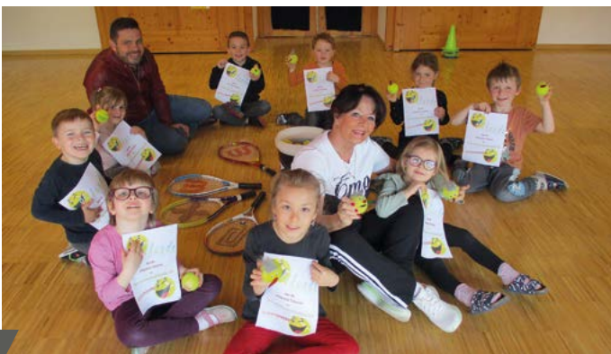
Die stolzen Kinder mit ihren Urkunden.