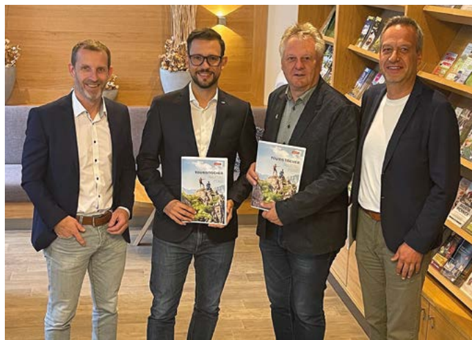
Es gilt nun, den touristischen Masterplan gemeinsam mit dem neuen Tourismusverband umzusetzen.

tiger Natur. Diese Entwicklung wurde zum Anlass genommen den Tourismus neu zu organisieren. Der Tourismus wird zukünftig nicht mehr über die Gemeinde oder einem Tourismusverband auf Gemeindeebene abgewickelt, sondern