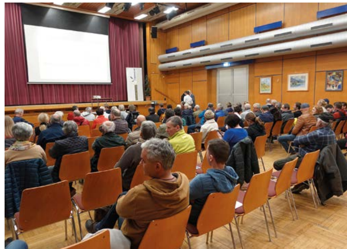
Viel Interesse bei den Präsentationen des ÖEK-Entwurfes.

Die Wintersaison ist in unserer Gemeinde wieder sehr erfolgreich verlaufen. Unsere Region hat auch in den letzten Jahren – im Gegensatz zum gesamten Bundesland Kärnten – bereits ausgezeichnete Nächtigungszahlen aufweisen können. Kärnten hat in den letzten Jahren und Jahrzehnten am Tourismusmarkt an Boden verloren. Die Gründe sind vielfäl-